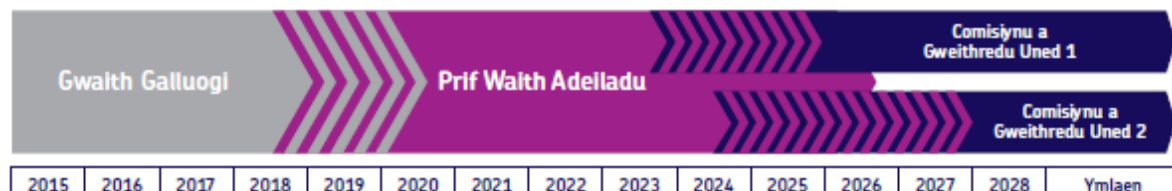
Ffigur 3: Yr amserlen a'r cyfnodau a gynigir ar gyfer Prosiect Wylfa Newydd

Byddwn yn cynnwys gwybodaeth am effeithiau posibl y cynigion ar gymunedau ac ar yr amgylchedd (gan gynnwys effeithiau cronus ein Prosiect gyda datblygiadau eraill sy'n digwydd ar adeg debyg), gan roi sylw i faterion fel nodweddion economaidd-gymdeithasol, y Gymraeg, hamdden, traffig a thrafnidiaeth, sŵn, ansawdd yr aer, priddoedd, hydroleg, ecoleg, llanw a cherrynt y môr, tirwedd a golygfeydd. Bydd gwybodaeth yn cael ei rhoi ar fesurau rydyn ni'n eu cynnig i ostwng unrhyw effaith andwyol bosibl fel gwaith tirweddu a darparu nodweddion a chynefinoedd bywyd gwyllt newydd. Bydd ein gwybodaeth ymgynghori hefyd yn cynnwys manylion am fanteision posibl y Prosiect i gymunedau ac i'r amgylchedd.