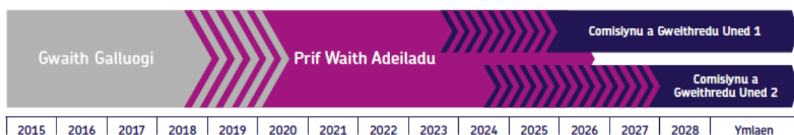
Ffigur 3: Yr amserlen a'r cyfnodau a gynigir ar gyfer Prosiect Wylfa Newydd

Byddwn ni'n cynnwys gwybodaeth am effeithiau cymunedol ac amgylcheddol posibl y newidiadau arfaethedig, gan edrych ar faterion fel effeithiau economaidd-gymdeithasol, y Gymraeg, hamdden, traffig a thrafnidiaeth, sŵn, ansawdd yr aer, pridd, hydroleg, ecoleg, yr amgylchedd morol, y dirwedd a golygfeydd. Bydd gwybodaeth yn cael ei rhoi ar fesurau rydyn ni'n eu cynnig i ostwng unrhyw effaith andwyol bosibl fel gwaith tirwedd a darparu nodweddion a chynefinoedd bywyd gwyllt newydd. Bydd gwybodaeth ein hymgyngoriad hefyd yn amlinellu'r camau lliniaru amgylcheddol ac economaidd gymdeithasol posibl byddwn ni'n eu cymryd i leihau'r effeithiau ar gymunedau lleol a gwella manteision y Prosiect.