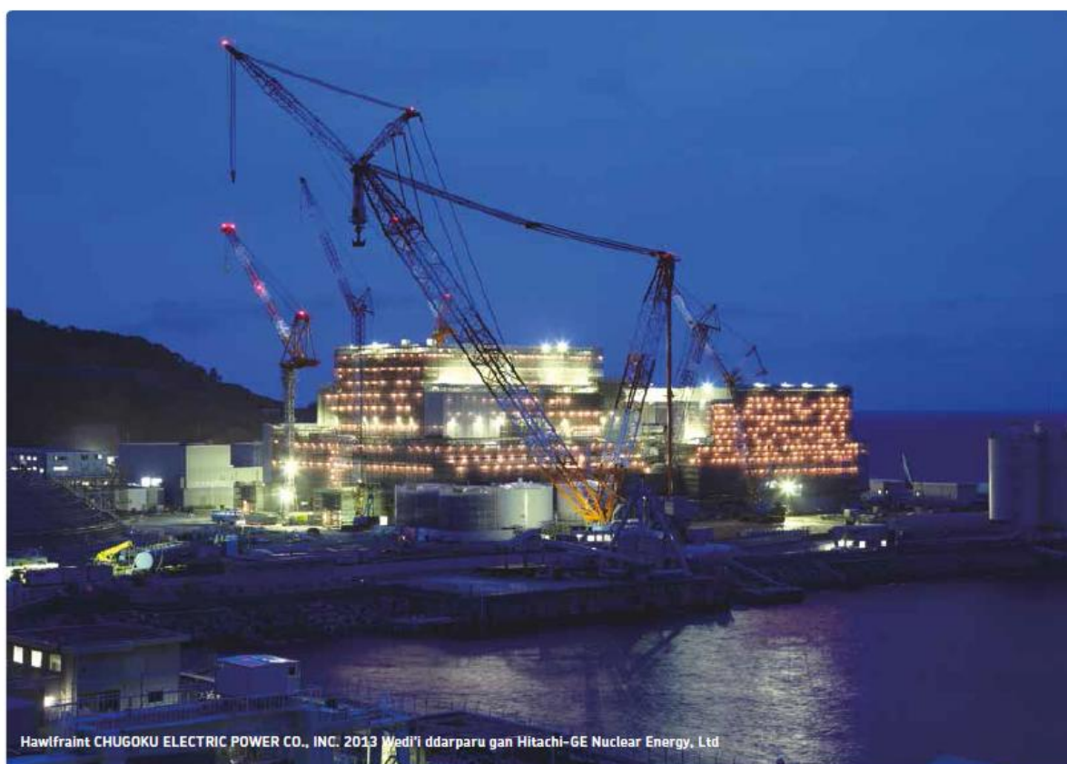
Ffigur 2: Adeiladu adeilad ABWR yn Shimane 3 yn Japan

Rydyn ni wedi darparu Gwybodaeth Amgylcheddol Ragarweiniol a diweddariadau i'r Wybodaeth Amgylcheddol Ragarweiniol yn ystod pob ymgynghoriad. Yn ein trydydd ymgynghoriad cyn ymgeisio byddwn yn darparu rhagor o wybodaeth amgylcheddol wedi'i diweddaru, gan ganolbwyntio ar effeithiau'r newidiadau i'r Prosiect.