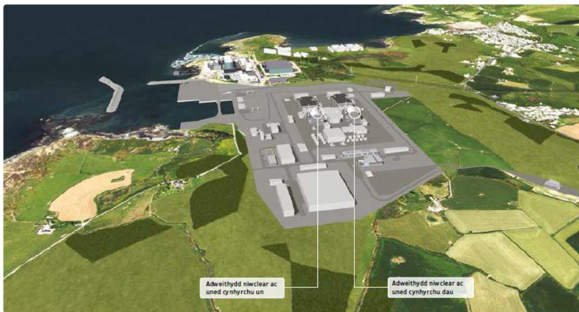
Ffigur 1: Lleoliad dangosol ein Gorsaf Bŵer